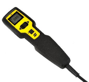
ER 1-multifunctionele afstandsbediening met digitaal beeldscherm