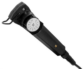
MMA 3-traditionele afstandsbediening voor het aanpassen van de stroomsterkte