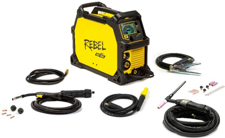
Rebel EMP 205ic AC/DC en onderdelen in verpakking.