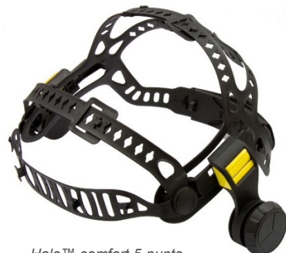
Halo™ comfort 5-punts hoofdband (vooraanzicht)