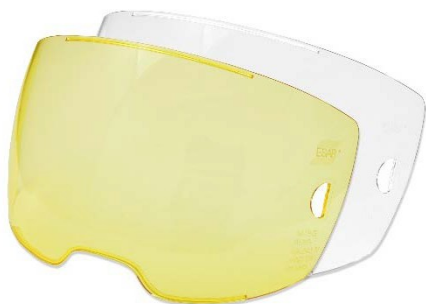
Beschermglas buitenzijde HD