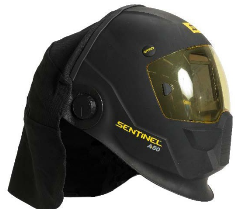
Nekbescherming (vlambestendig katoen)